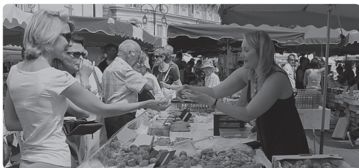
СЕРЖИТ УЭССЕНСА ГАВЬЯЛЛИТ

» Замечательный хлеб можно купить на рынке в Аянчо, Корсика